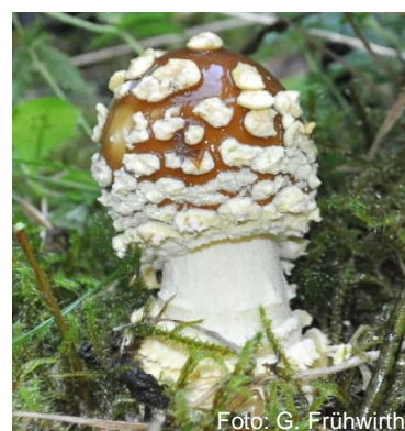
Amanita muscaria (Fliegenpilz)